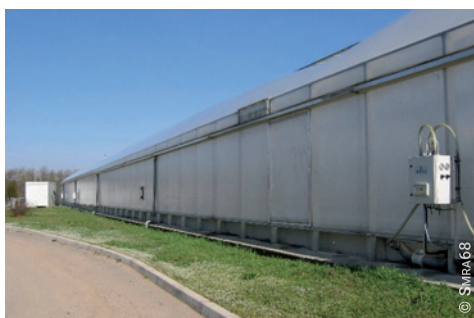
Serre de séchage solaire sans plancher chauffant (STEU d'Ensisheim – Haut-Rhin)