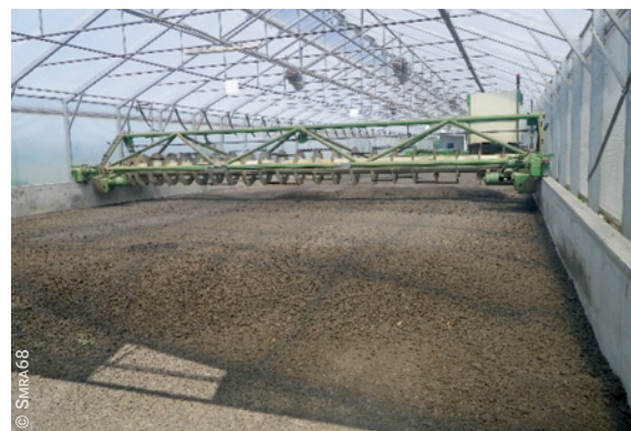
Scarificateur en fonctionnement (STEU de Sierentz – Haut-Rhin)

L'épaisseur des boues dans la serre (un maximum de 15 cm est recommandé) et la fréquence des brassages (jouant sur la taille des granulés obtenus et donc l'homogénéité de leur siccité interne) sont importantes. Le pilotage du processus est ici primordial : il demande