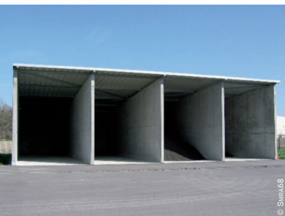
Casiers de stockage des lots de boues séchées (STEU de Biesheim – Haut-Rhin)