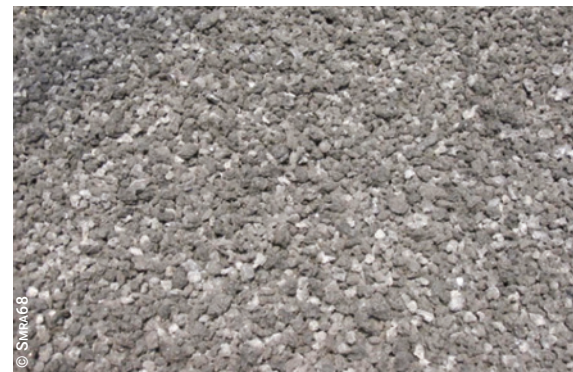
Boues séchées en sortie de serre (STEU d'Ensisheim – Haut-Rhin)

La serre de séchage est recouverte d'un revêtement translucide, permettant une bonne transmission du rayonnement solaire (UV) et favorisant l'échauffement de l'air ambiant. Elle est munie d'ouvrants et/ou d'un système de ventilation forcée, voire ouverte à ses extrémités, pour permettre l'élimination